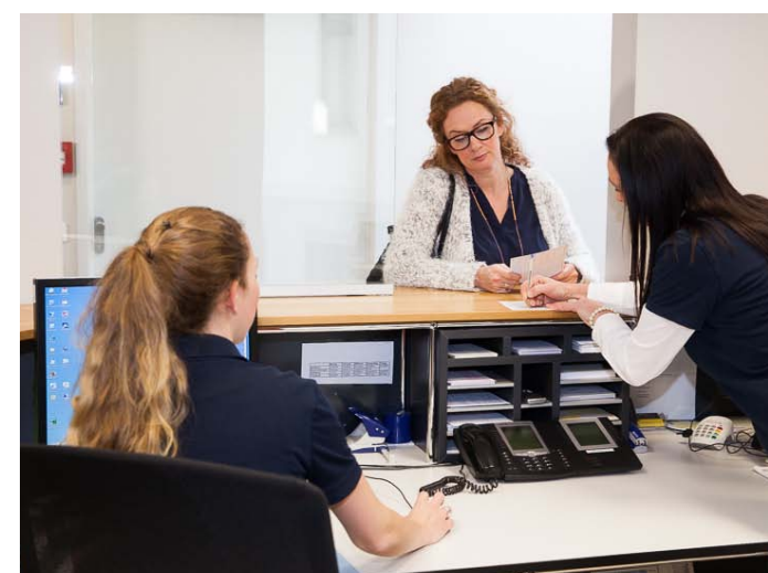
Troisdorf am St. Josef-Hospital