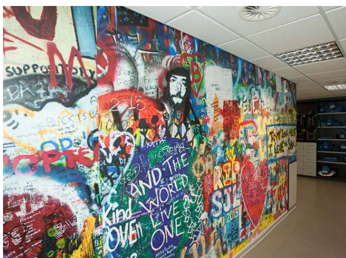
Bonn-Bad Godesberg am Waldkrankenhaus