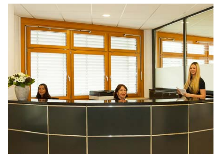
Euskirchen am Marien-Hospital